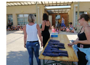
2020 : remise des cadeaux de l'APE aux grandes sections partant en CP

À tous les parents désirant nous aider pour l'organisation des événements vous êtes évidemment les bienvenus. Merci à tous Vous pouvez nous joindre par mail : Ape.saintgenies@outlook.fr